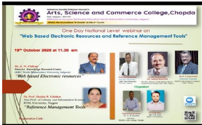
Brochure of the Webinar