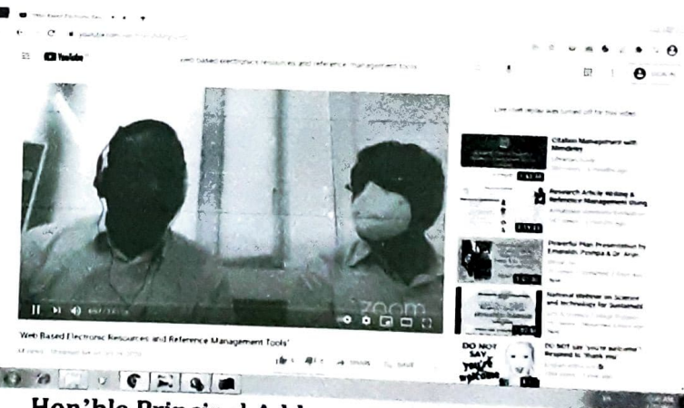
Hon'ble Principal Addressing the Audience during his presidential speech